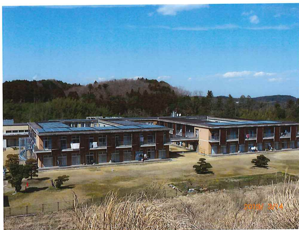
(溪泉荘 A 棟・B 棟屋根に設置したソーラーパネル)