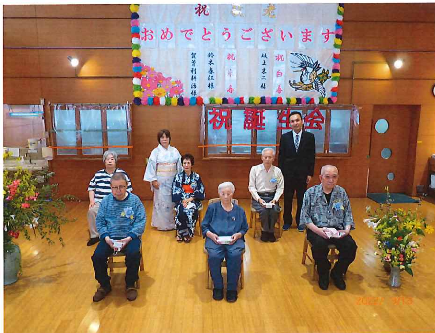
(令和4年9月 誕生会撮影)