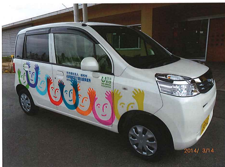
(日本財団より寄贈された福祉車両)